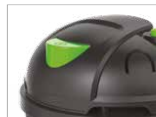
INTERRUPTEUR MARCHÉ/ ARRÊT ACTIONNÉ AVEC LE PIED