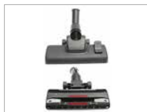
NOUVELLE BROSSE PUISSANTE POUR UNE EFFICACITÉ DE NETTOYAGE ÉLEVÉE