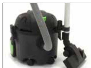
POSITION DE STATIONNEMENT